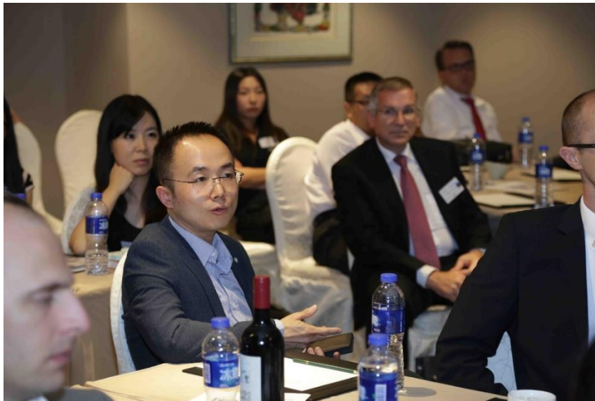
图 5：研讨会讨论精彩瞬间

课题之外，其他关键因素，比如相关数据是否易于采集、采集数据的质量是否过关、销售管控的工具和 IT 系统支持是否到位等，对销售管控的成功也有很大影响。企业的长期目标应该是把销售部门进一步发展成为一个能够按照自我控制原则运行的精益组织。财务管理控制师不应将自己定位为监控机器，而是将自己作为销售部门持续改进过程的支持者和推动者。